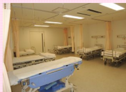
ベットが充実した点滴室