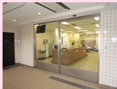
救急車で搬送された患者様を直接救急センターへ運ぶことが可能

待合室の壁は取り外し可能で、大規模災害などが発生した場合はこの壁を取り外し、災害拠点病院としての役割をはたします。