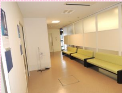
待合室ソファの後ろの壁は取り外しが可能

新設された外来化学療法センターはベット数を増床しました。室内を木目調で統一して患者様に落ち着いて治療を受けていただけるような環境にし、看護師と落ち着いて話し合える相談室も併設しました。