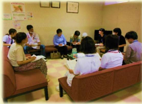
母子保健・医療・福祉連携会議

悩まれていることがありましたら、お母さんの了解のもと、地域の保健師と連携を図って、サポート（情報提供や保健師訪問）をさせていただきます。